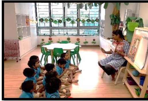
ஆசிரியர் சொல்லடிகளைக் காட்டிச் சொற்களை வாசித்தல்